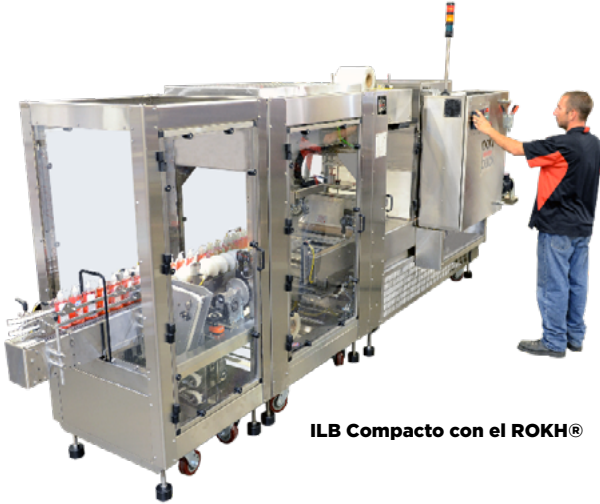
ILB Compacto con el ROKH®